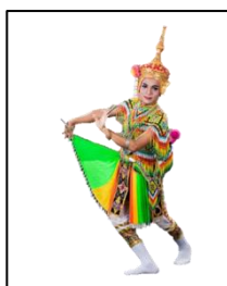
การแสดงพื้นบ้านมโนราห์