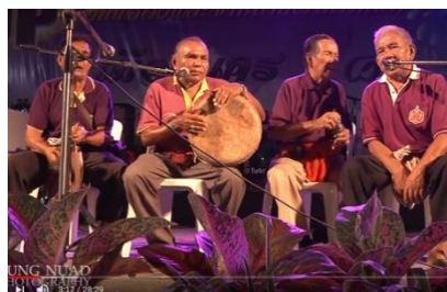
การแสดงพื้นบ้านเพลงบอก