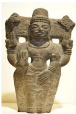
(ภาพเทวรูปพระนารายณ์)