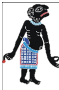
อ้ายเท่ง

4.3 ผู้สอนเฉลยคำตอบว่าแต่ละภาพคืออะไร และเป็นส่วนประกอบของการแสดงพื้นบ้านและภูมิปัญญาใด เพื่อให้ผู้ศึกษามีความเข้าใจที่ถูกต้อง