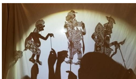
การแสดงพื้นบ้านหนังตะลุง