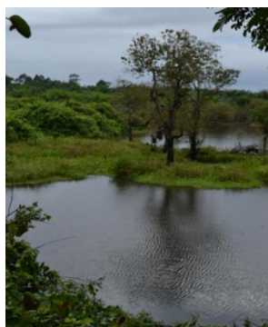
(ภาพอู่เรือ)